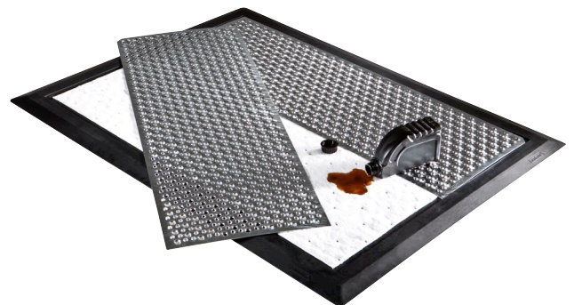
Matte mit Inlaytasche für Vlieseinlage und Trittschutzgitter